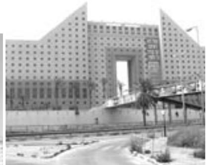
מגדלי חוף הכרמל

מספר דוגמאות מהשנה האחרונה מעלות את החשש, כי על אף הניסיון המר - לא הופנם הלקח לגבי הצורך להתחשב בפיתוח עורך החוף. יתרה מכך, נראה שדבר לא השתנה, למעט אולי השיטה והיעלמות הבושה. בעבר, מכרו דירות למגורים במסווה של דירות נופש, היום בונים שכונה לעשירים במסווה של הרחבה לקיבוץ במצוקת דיור, בונים פנטהאוז במסווה של קיוסק ומתכננים מלון על המים במסווה של שיקום מצודה טמפלרית.