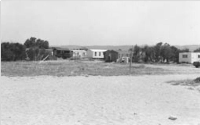
מקום למחשבה. חוף נווה ים

במהלך השנה האחרונה החל מיזם משותף של קיבוץ געש ושל חברת "סקום", לבנות ולשווק את שכונת "געש על הים" - 30 בתים צמודי קרקע על מגרשים בגודל של דונם ויותר. מהלך זה לא נעשה במחטף, אלא באישור הוועדה המקומית חוף השרון, שאישרה ביוזעין אף את הקמתן של בריכות שחייה פרטיות בתחום המגרשים. בעקבות פנייה של מפלגת הירוקים בהרצליה, פנה היועץ המשפטי לממשלה לבית המשפט, וזה הורה להפסיק את העבודות בפרויקט.