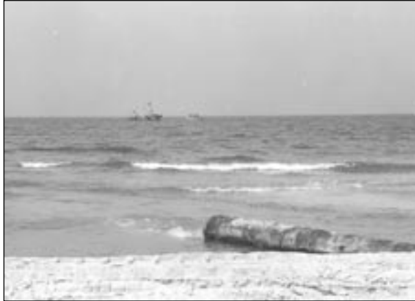
השפכים של 'תעשיות אלקטרוכימיות'

10. חוף הרצליה - זיהום הים נובע בעיקרו כתוצאה מעומסים, מתקלות ומגלישות של מכון הטיהור של הרצליה, המזרים בימים כסדרם מי ביוב מטהרים לעומק הים.