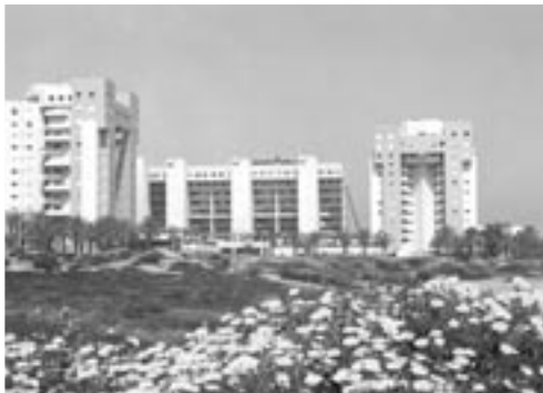
סי אנד סאן