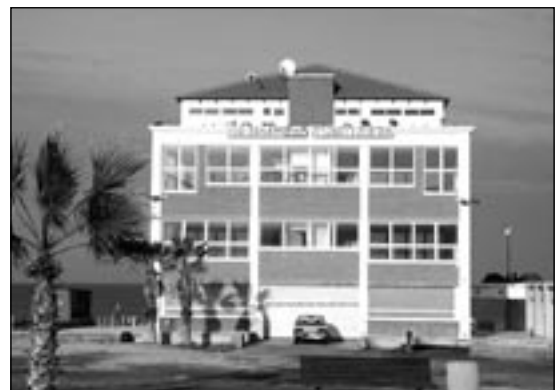
הקיוסק והפנטהאוז באשדוד. הוועדה המחוזית הכשירה את עבירות הבניה

אישור התכנית המופקדת במתכונתה הנוכחית מהווה נקודת שיא לכשל אכיפתי מתמשך, המתבטאת בשיתוף פעולה בלתי מובן עם פורע חוק, תוך פגיעה בזכויות הקניין והשוויון של כלל הציבור. הכשר כולל בדיעבד על ידי הרשויות האמונות על שמירת החוק, בייחוד בעבירה נמשכת ובוטה כגון זו, משדר לציבור מסר קלוקל של עידוד עבריינות, וזאת בניגוד מוחלט למדיניות תקינה של המנהל ולאינטרס הציבורי. החברה להגנת הטבע, הפורום הציבורי לאיכות הסביבה באשדוד ואדם טבע ודין הגישו ערעור למועצה הארצית על החלטה זו.