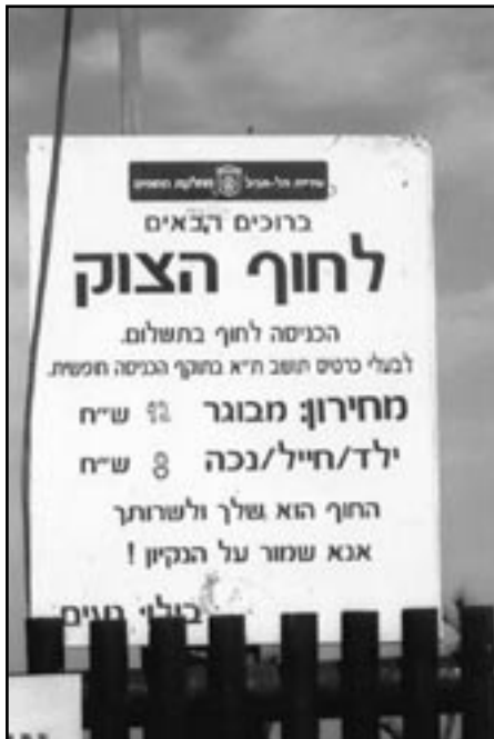
חוף הצוק. גובים תשלום מהולכי רגל

גביית תשלום מהולכי רגל באופן ישיר נעשית כיום רק בחופים הבאים: חוף הצוק בת"א, חוף דור, חוף נווה ים, החוף השקט בחיפה והחוף העירוני בנהריה. אולם בפועל, ישנה גבייה עקיפה מהולכי רגל בשורה של חופים ובשיטות שונות, להלן שתי הנפוצות שבהן: