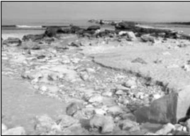
הביוב העירוני של נהריה נשפך לים

לפי כללי אמנת ברצלונה, אשר אושררה על ידי מדינת ישראל וקיבלה ביטוי בחוקים למניעת הזרמה לים, חל איסור להזרים או להטיל פסולת אל הים, למעט לפי היתר זמני של ועדה בינמישרדית, שהרכבה קבוע בחוק. למרות זאת, קיימים לאורך חופי הארץ מספר לא קטן של מוקדי הזרמה של שפכים תעשייתיים ו/או ביתיים, אשר הזרמתם מתאפשרת. להלן תיאור נקודות ההזרמה העיקריות לאורך חופי הים התיכון, כפי שפורסם בדוח שנערך השנה על ידי עמותת 'צלול'.