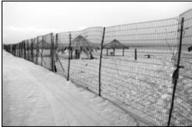
ניצנים. חוף מגודר למשך חודש וחצי בגלל אירוע של ארבעה ימים

המועצה האזורית ויושב הראש שלה, על המנהל ועל החברה הכלכלית, החובה להימנע ממתן רשיון עסק וממתן הרשאה לפעולות הנעשות שלא כדין, ולפעול להפסקת פעולות הנעשות בניגוד להרשאה שניתנה, או ללא רשיון עסק ביחס לפעולות המחייבות רשיון עסק".